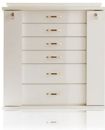
8417 BIJOUX ARTICO

Cassettone portagioielli in acero occhiolato artico, finitura lucida. Accessori in ottone placcato oro 24 carati. Chiudendo i due sportelli a chiave tutte le cassette vengono bloccate. Gli interni sono organizzati per contenere tutti i tipi di gioielli e rivestiti di tessuto antiossidante. I due sportelli all'interno contengono 4 portacollane ed il coperchio uno specchio regolabile.